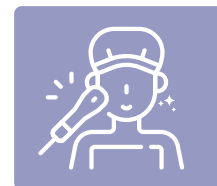
フォトフェイシャル